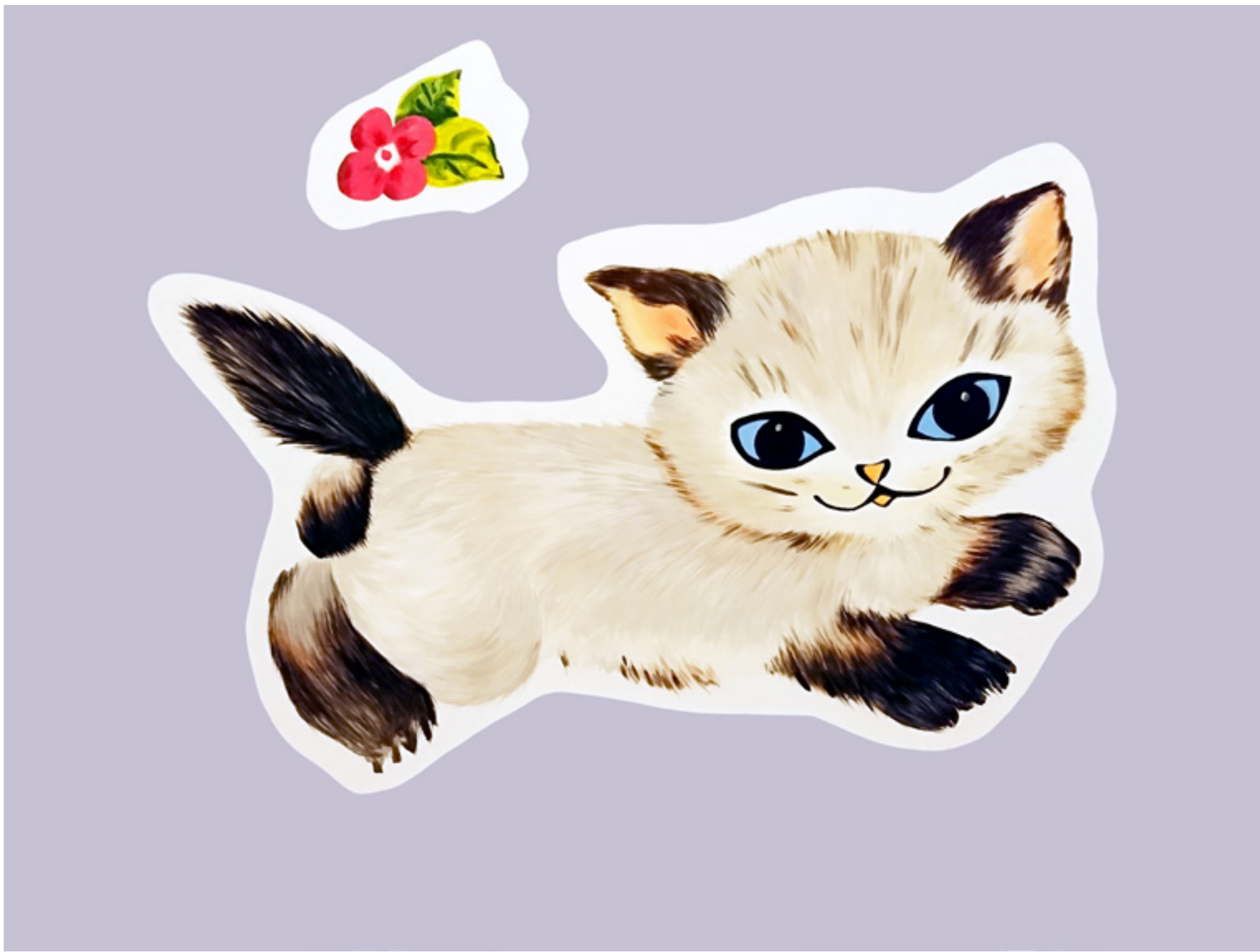
Fehér cica (2019) olaj, vászon, 125 × 160 cm