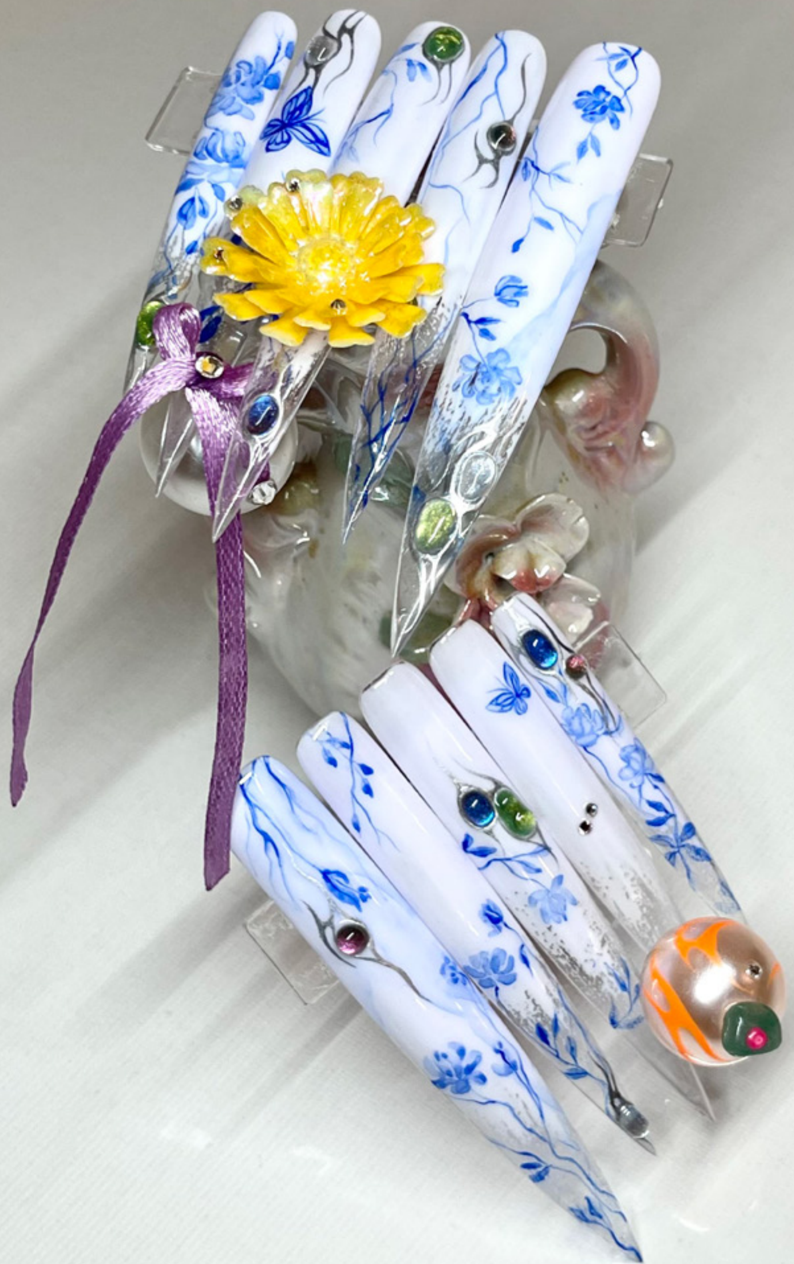
Úri huncutság (2022) műköröm alap, géllakk, akvarell, gyöngyök, Swarovski strassz, művirág, szalag 8 × 13 × 3 cm