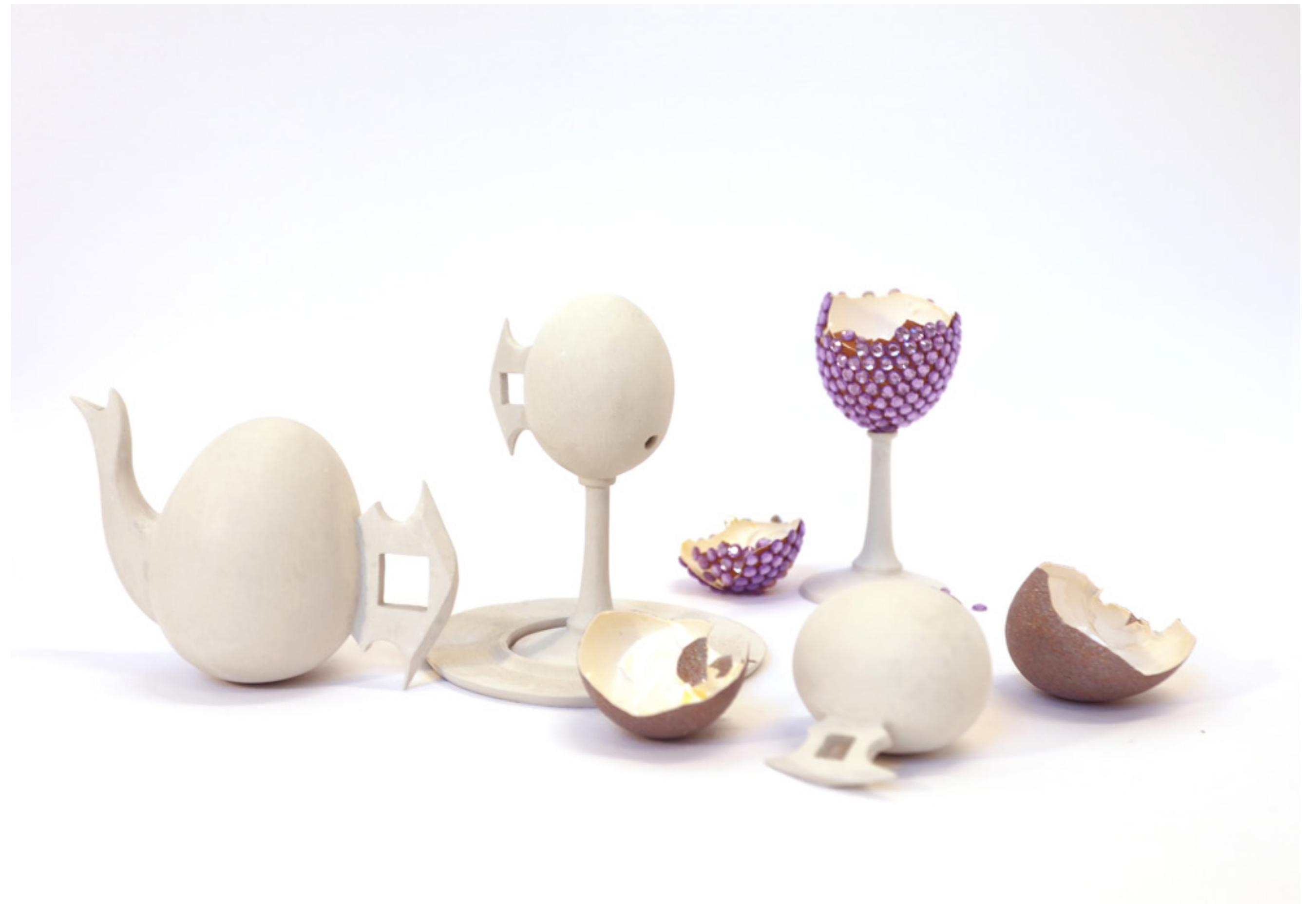
Férközzetek fazakak, hogy férjenek a csuporkák is (2020) fehér agyag, tojáshély, strasszok, körömlakk

A Tisztaszoba című tárgyegyüttes a 19. századi magyar hozományrendszer egyik kevésbé értékes elemére, a stafírungra (törölköző, terítő, fehérnemű, étkészlet) reflektálnak. Ezek a használati tárgyak fiatal nő egyéni tulajdonát képezték, aki saját ládájában tartotta őket, a férj nem vehetett el belőlük semmit. A hozomány átadása az új házba fontos momentuma volt az esküvőnek, mivel ezúttal a menyasszony keze munkája került nyilvánosságra, a faluközösség elismerte és megszentelte azt. A tiszta szoba a ház utcához legközelebb eső része volt, amelyet a hozomány legszebb darabjaival és tisztelt tárgyakkal díszítettek. Ez a szoba a különleges vendégek számára volt fenntartva, mindig tisztán és hidegen tartották. A helyiség a társadalmi rangot, a felsőbbrendűséget és a házban élő nő személyiségét jelképezte. Ez a helyspecifikus installáció párhuzamot von a tiszta szobában elhelyezett hozomány egyes darabjai és a tárgyak mint műalkotások között. Mindegyik tárgya a 19. századi hozomány egyes darabjaira és a korszak jellegzetes népi hagyományaira reflektál, a tárgyak címei egy-egy magyar közmondás. A tisztaszoba ebben az esetben azonos a kiállítóterrel, ahol a néző a násznép szerepét tölti be, aki a hozományt mint műalkotást szemléli és ítéli meg.