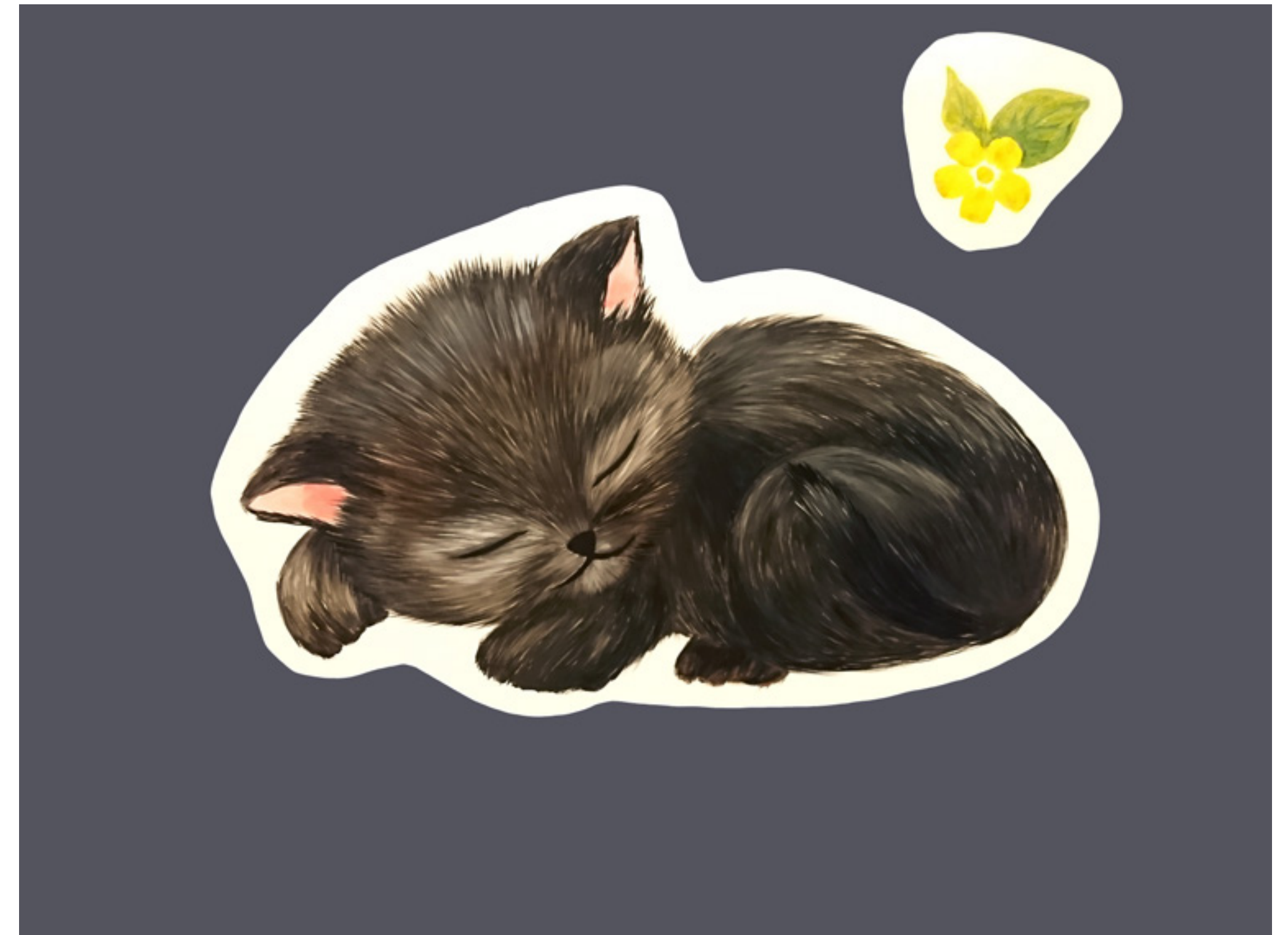
Fekete cica (2019) olaj, vászon, 125 × 160 cm