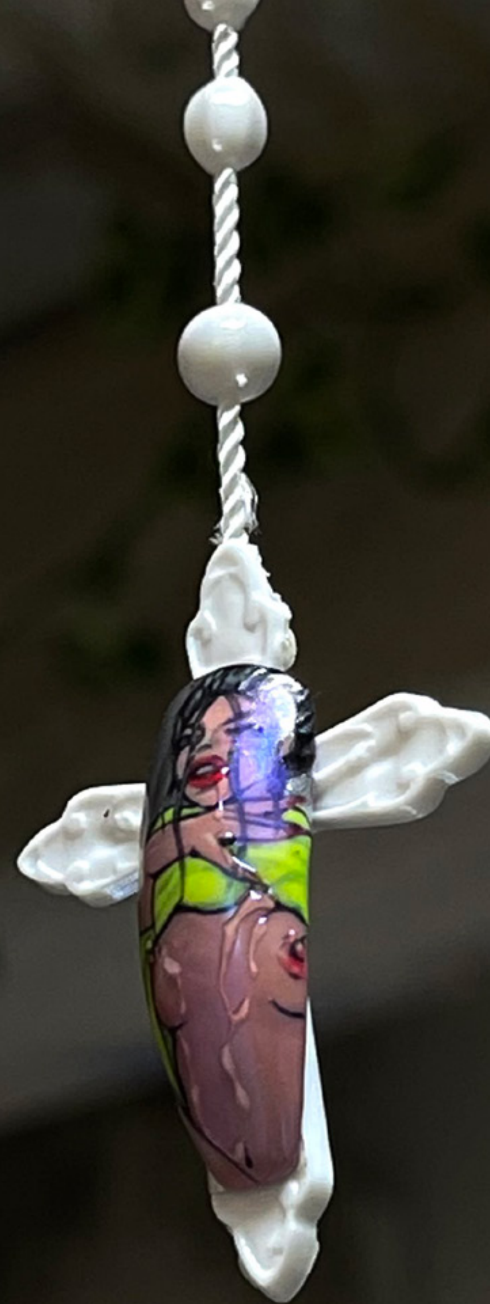
Penitencia (2021) műkөрөм alap, polimer мұгыанта, мұаыаг, бөр, асёл 85 x 3 cm