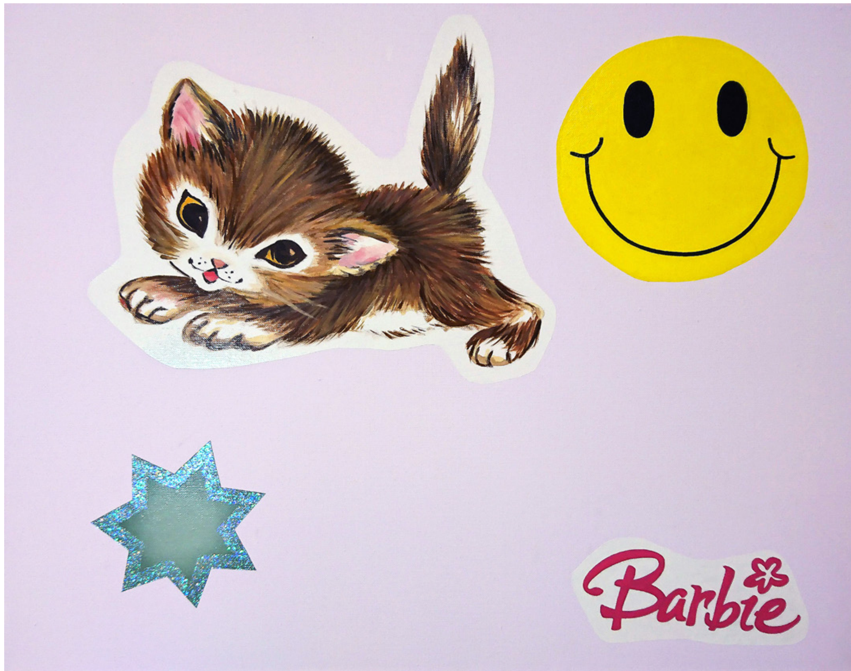
Marcie (2020) olaj, vászon 60 x 77 cm