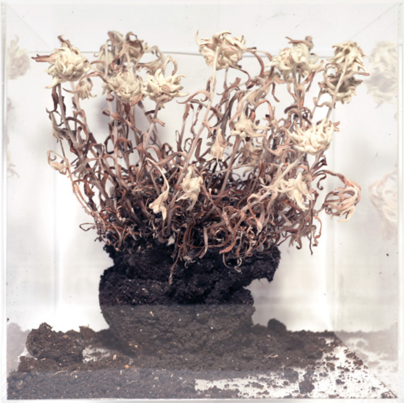
Száraz gyom könnyen lánggra lobban (2020) havasi gyopár, virágföld, plexi 30 × 30 × 30 cm