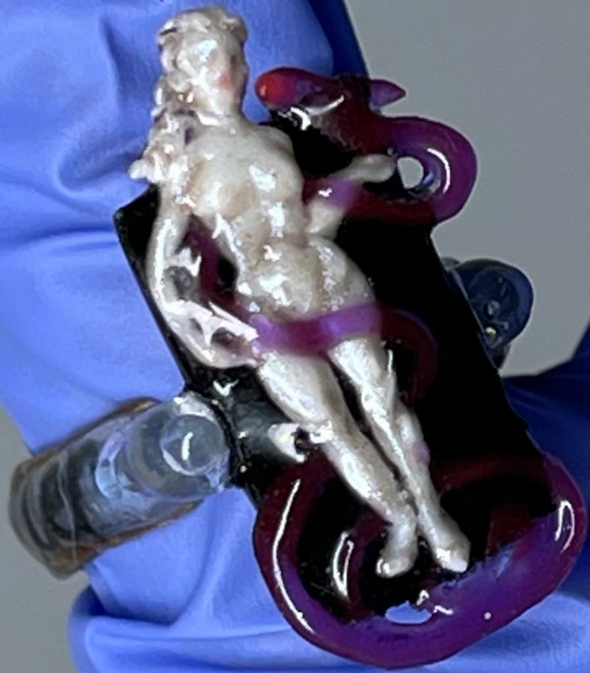
Sapiens Iuvenis Mulier (2023) polimer műgyanta, 2 × 1,5 × 1,5 cm