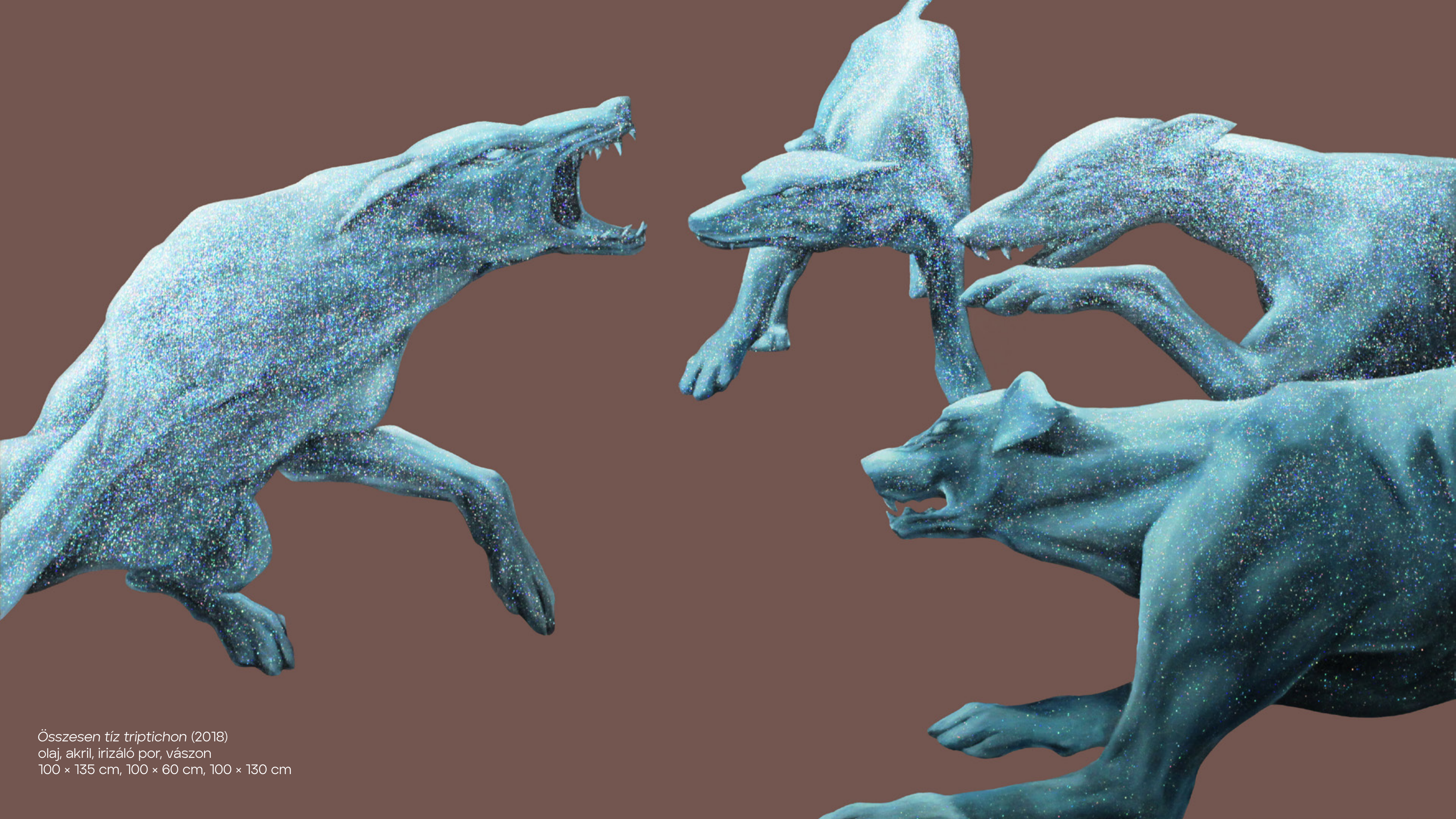
Összesen tíz triptichon (2018) olaj, akril, irizáló por, vászon 100 × 135 cm, 100 × 60 cm, 100 × 130 cm