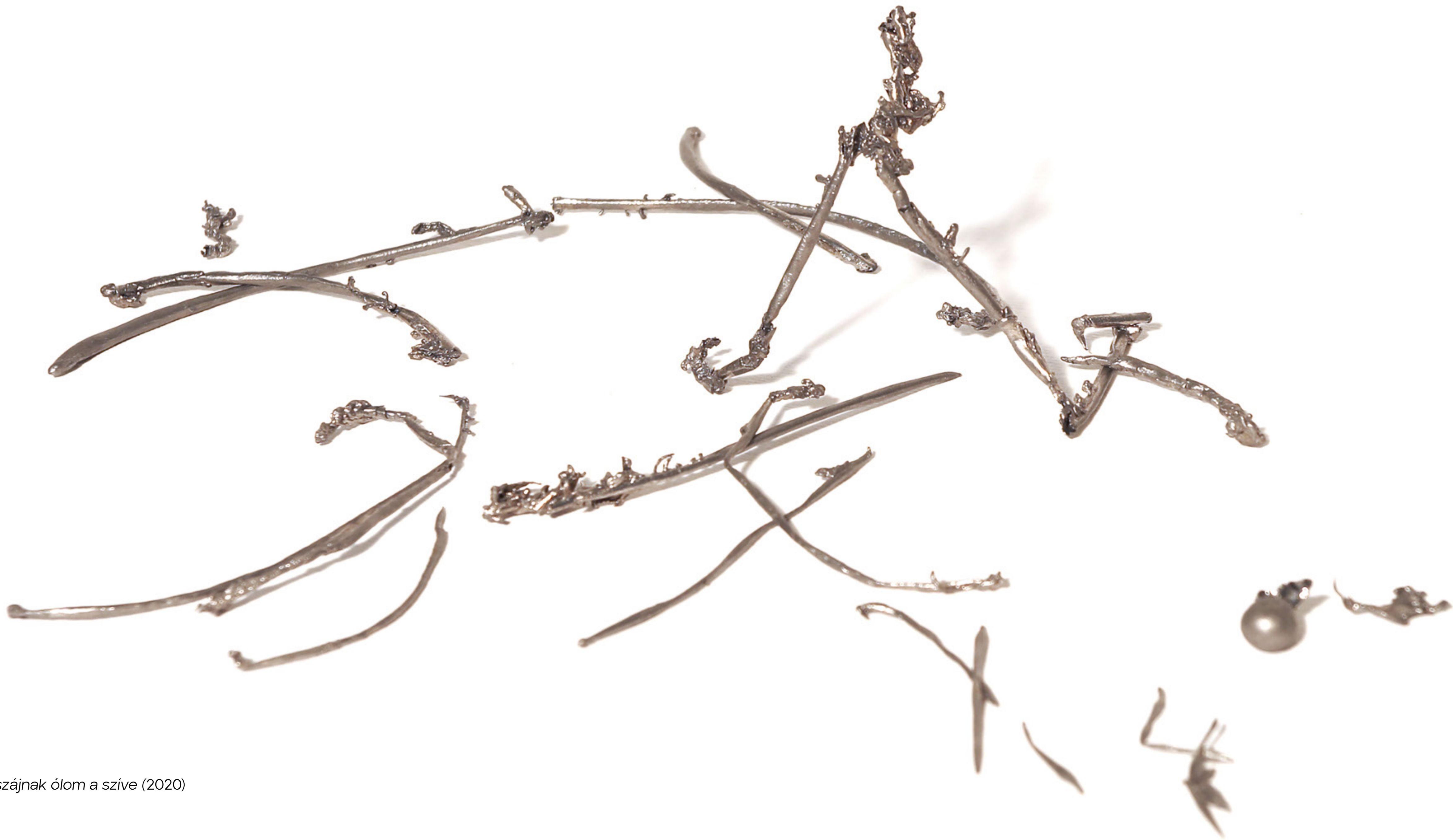
Vas szájnak ólom a szíve (2020) ólom