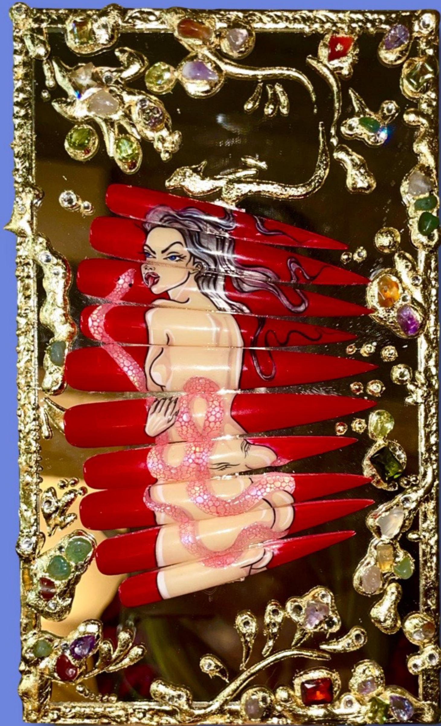
A rossz lányok melankólikusan befektetnek a halálba (2022) tükör, műköröm alap, géllakk, aranyfüst fólia, cirkónia, kristályok, Swarovski sztrassz 23 × 15 cm