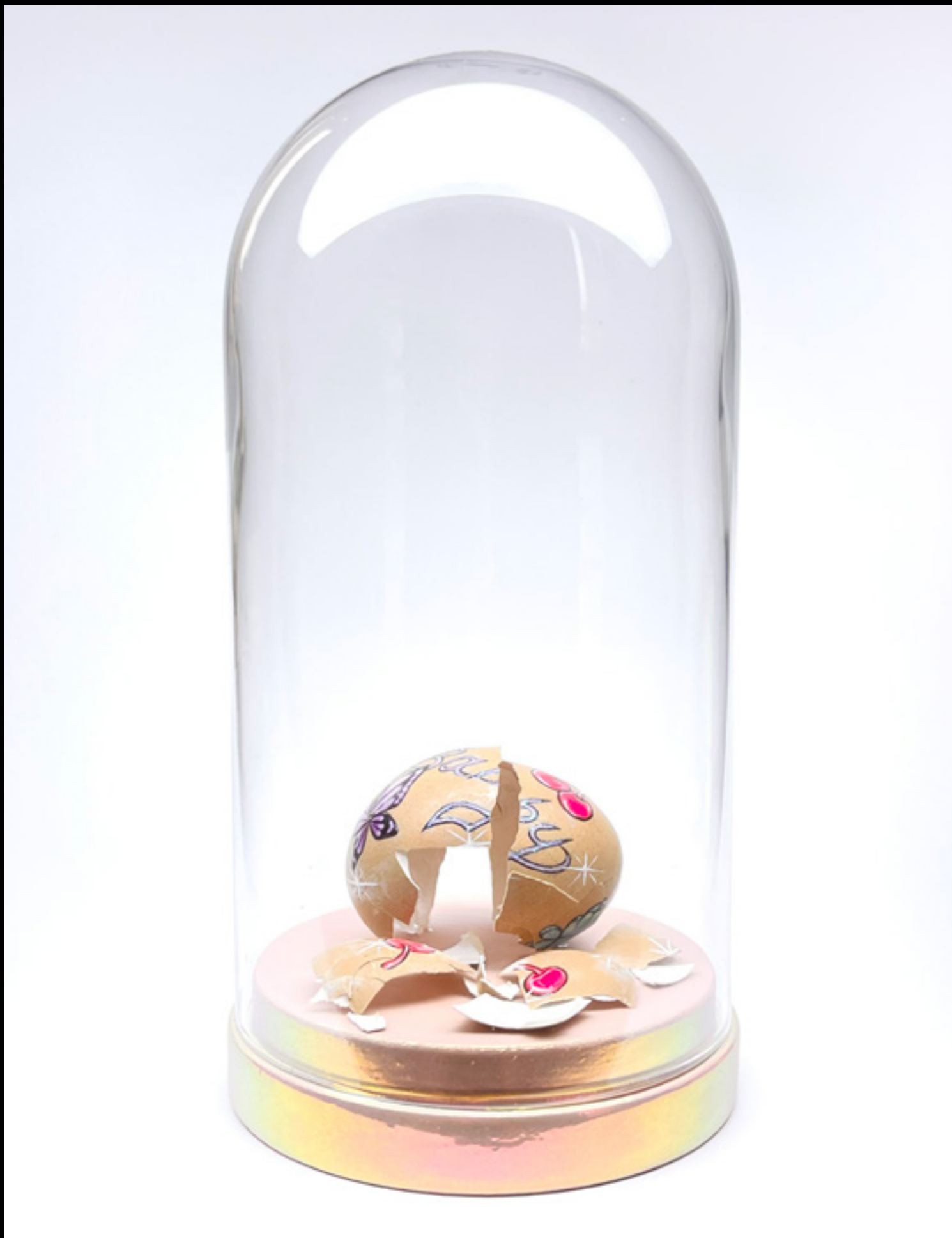
Jesus Was a B-Boy (2021) tojáshéj, körömlakk 4 x 3 x 3 cm