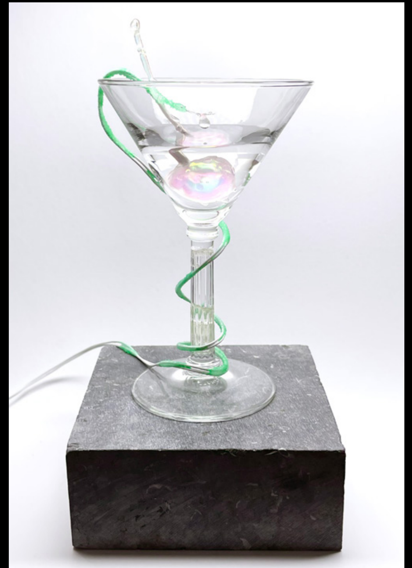
Szelídebb a bestia ha eleget alszik (2023) üveg, led, polimer műgyanta 14 x 9 x 9 cm