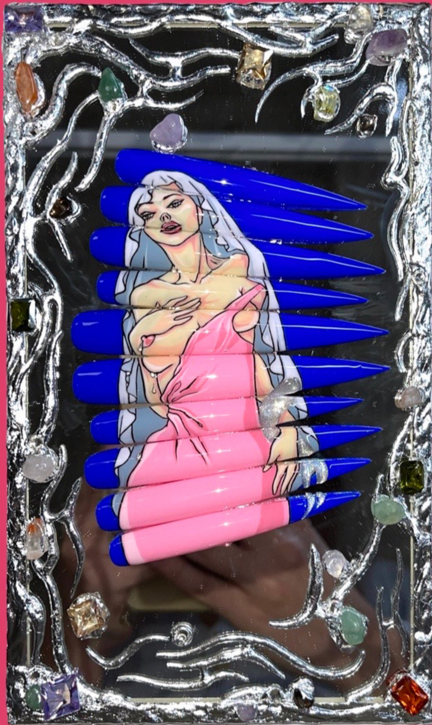
Szoptató madonna (2022) tükör, műköröm alap, géllakk, aranyfüst fólia, cirkónia, kristályok, Swarovski sztrassz 23 × 15 cm